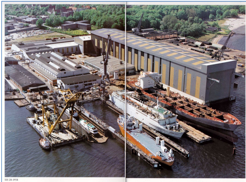
Vorbild für das Diorama

© FSG. Aus Workmanship von etwa 1988, S. 2-3