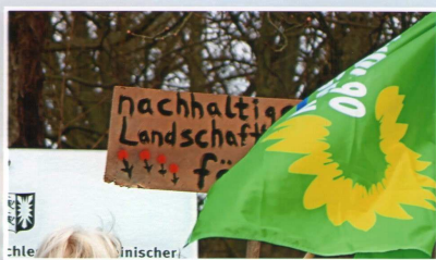
Grebiner auf der Demo vor dem Landeshaus Kiel

Der genaue Termin des nächsten Treffens im Mai ds. Jhs. wird rechtzeitig am "Schwarzen Brett" am "Kinderspielplatz Grebin" sowie an der "Alten Schule Görnitz" und auch hier im "Forum Grebin" bekannt gegeben.