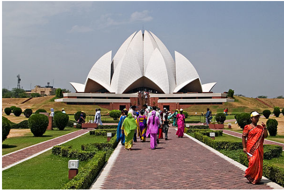
Das auf einem Neuneck beruhende Haus der Andacht der Bahai in Delhi