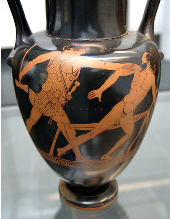
Theseus und Prokrustes, attische rotfigurige Halsamphora, 470–460 v. Chr., Staatliche Antikensammlungen (Inv. 2325)

Prokrustes (griechisch Προκρούστης „Ausstrecker“) war ein Riese aus der griechischen Mythologie, Beiname des Polypemon oder Damastes, eines attischen Räubers in der Umgegend von Eleusis und Sohn des Poseidon.