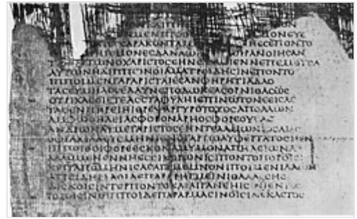
Die Verse Ilias II 757–775 in Oxford, Bodleian Library, Papyrus Hawara 24-28 (2. Jahrhundert)

Ausgehend von den Homerübersetzungen von Johann Heinrich Voß spielte in Deutschland Homer für den „Volks“- und „Natur“-Begriff der deutschen literarischen Klassik und Romantik die größte Rolle, weil man in Ilias und Odyssee einen Beweis dafür sah, dass das Volk eine eigene authentische Stimme habe (vgl. Volkslied ), dass aus ihm die Natur selbst spreche. In diesen Zusammenhang gehörte auch das Aufwerfen der „Homerischen Frage“, denn entschied man sich gegen die Autorschaft Homers, so waren