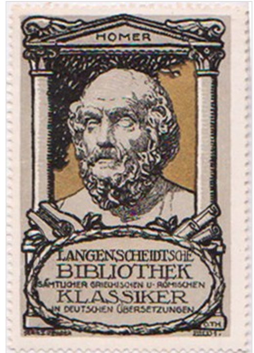
Homer auf einer Sammelmarke des Langenscheidt-Verlags