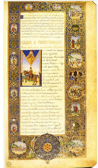
Die Ilias in einer Handschrift □ des 15. Jahrhunderts mit Miniaturen von Francesco Rosselli . Florenz, Biblioteca Medicea Laurenziana , Plut. 32.4, fol. 43r

Der Asteroid (5700) Homerus trägt seinen Namen.