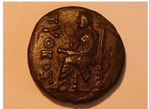
Homer auf Münze aus Kolophon , ca. 50–30 v. Chr.