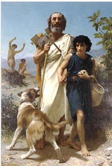
Der blinde Homer mit der Lyra auf dem Rücken wird geführt. Gemälde von William Bouguereau , 1874