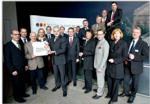
Die Jurymitglieder 2011